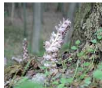
Schuppenwurz ( Lathraea squamaria ).

erkennen, hat man z.T. auch aus forstästhetischen Gründen Bäume eingebracht, die unter den standörtlichen Bedingungen z.B. gerade noch wie die wenigen Fichten neben Kiefern und verschiedenen Laubgehölzen einen Bewuchs ausmachen. Gegenüber dominiert die Rotbuche ( Fagus sylvatica ). Im Tal, an der „Häschenbrücke“ über die Bockau, im Umfeld einer Pappel beobachte ich seit Jahren eine parasitäre Lebensform, die der Schuppenwurz ( Lathraea squamaria ).