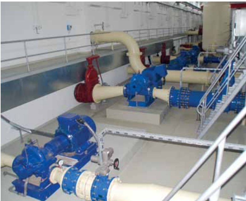
Die alten Pumpen im Wasserwerk Fichtenberg, die durch neue ersetzt werden.

Im Wasserwerk Fichtenberg erfolgt in den Jahren 2019/2020 der Komplettumbau der vorhandenen Förderpumpen inklusive der zugehörigen rohrtechnischen Anlage. Diese Maßnahme erhöht nicht nur die Versorgungssicherheit, sondern dient auch der Steigerung der energetischen Effizienz. So kann mit den neuen Pumpen der im Verbundsystem vorhandene Bedarf besser abgedeckt werden. Die jetzt vorhandene Rohrtechnik auf der Saugseite der Reinwasserpumpen stammt noch aus dem Jahr 1980 und hat aufgrund des damals eingesetzten Materials seine Grenznutzungsdauer erreicht.