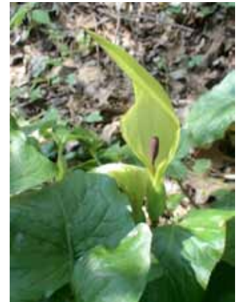
Aronstab ( Arum maculatum )